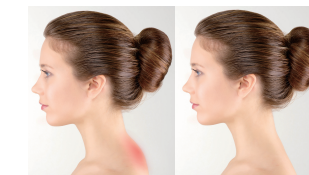
進行疏通、激活、排痛等程序